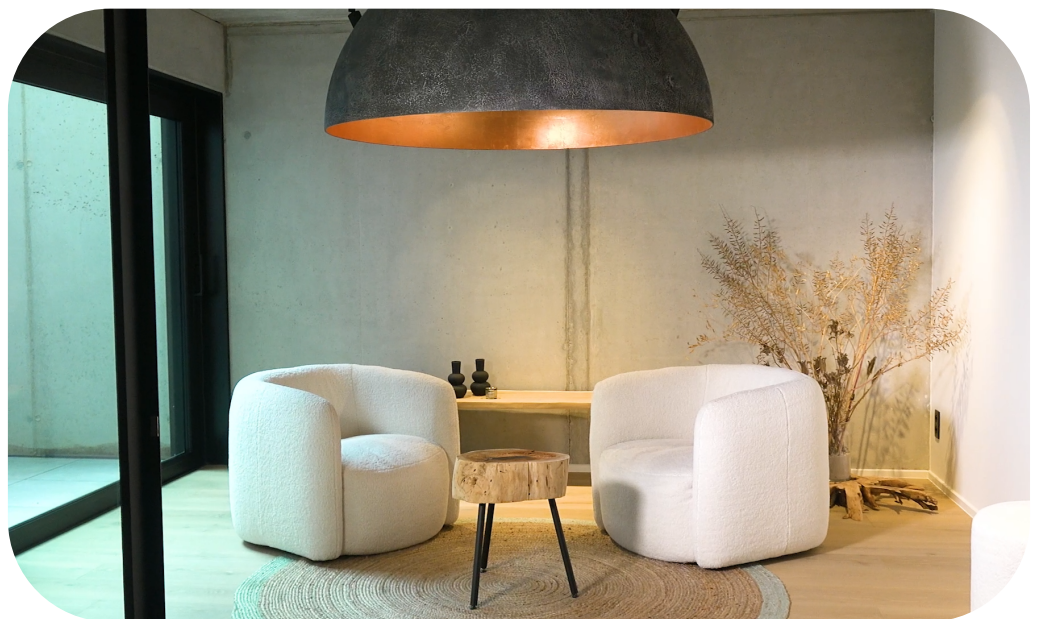
Still uit bedrijfsvideo voor Renner Interieur

Het creëert een audiovisueel item. Een item dat je altijd en overal kan gebruiken. Het is persoonlijk, en je kan er tegelijkertijd veel personen mee bereiken.