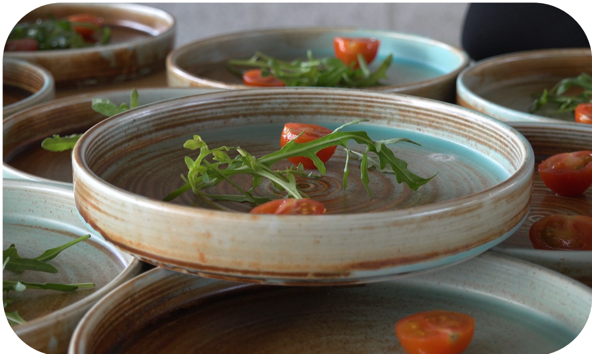
Still uit promotivideo voor Traiteur De Bourgondiër

Eventuele wijzigingen aan het contract moeten schriftelijk zijn en door beide partijen zijn ondertekend. Om de boeking en de acceptatie te verifiëren moet het document ondertekend worden met naam, datum en handtekening.